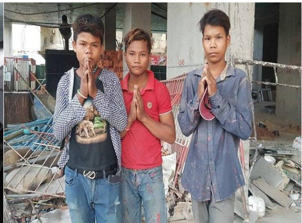
ក្មេងប្រុសដែលមានអាយុពី ១៣ ដល់ ១៥ ឆ្នាំដែលធ្វើជាកម្មករសំណង់មួយកន្លែងនៅរាជធានីភ្នំពេញ