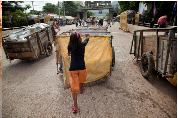
កុមារីញែរទះដីកតវ៉ាន់ឆ្លងដែន (ពេលទៅយកតវ៉ាន់ពីទឹកដីថៃ)