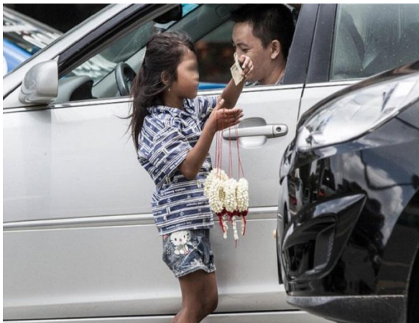
កុមារីដែលលក់ផ្កាលើមហាវិថីសហព័ន្ធរុស្ស៊ី