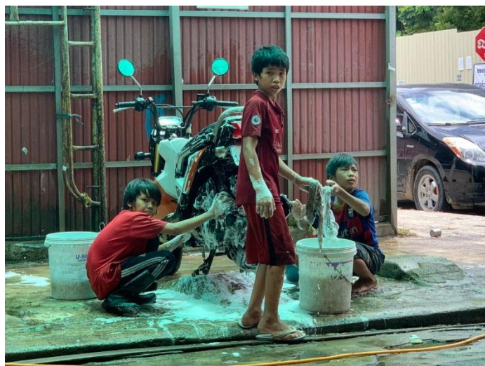
កុមារា ដែលធ្វើការនៅកន្លែងលាងសម្អាតយានយន្តមួយកន្លែងក្នុងរាជធានីភ្នំពេញ