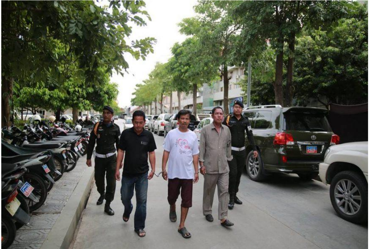
សមត្ថកិច្ចសម្រេចបញ្ជូនមន្ត្រីជាប់កិច្ចសន្យា នៃមន្ទីរសង្គមកិច្ច រាជធានីភ្នំពេញ ចំនួន៣នាក់ ទៅតុលាការ បន្ទាប់ពីសង្ស័យថាពួកគេជាប់ពាក់ព័ន្ធករណីកេងប្រវ័ញ្ចពលកម្មលើអ្នកសុំទាន ដែលរួមមានអ្នកសុំទានជាកុមារផងដែរ។