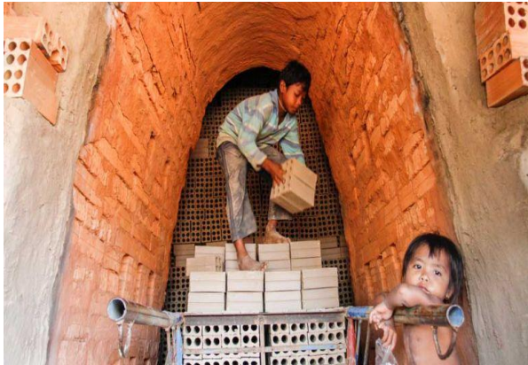
កុមារា ដែលធ្វើការនៅសិប្បកម្មផលិតឥដ្ឋមួយកន្លែង